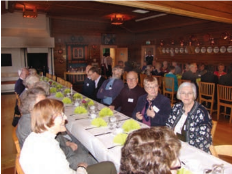
Förväntansfulla middagsgäster från hela Uppsala stift

Efter denna utflykt var kom vi tillbaka till församlingsgården och middagen. Som vanligt under ”kyrkans tak” är det en kulinarisk upplevelse. Det doftade förföriskt från köket och väl till bords besannades våra förväntningar. En fantastisk middag.