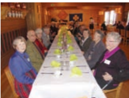
”Den som väntar på något gott . . .”

Ljusnandalen – jag har sagt det förr och jag säger det igen. Har ni möjlighet så besök den underbara dal där Ljusnan rinner så ta chansen. Skulle ni inte ha ett ärende så se till att hitta på en anledning att besöka Hälsingland.