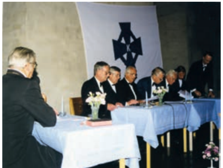
Medlemmar ur Enköpingskåren framför krönikespelet "Lekmannaförbundet 80 år"