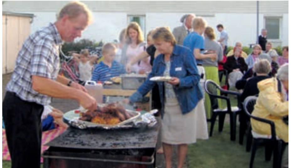
Grillkväll är populärt både hos ung och gammal

För att behållningen ska bli så stor som möjligt för såväl vuxna som barn samlas barn och ungdomar i olika åldersbaserade grupper, under tiden som alla vuxna ges möjlighet att lyssna till föredrag i lugn och ro.