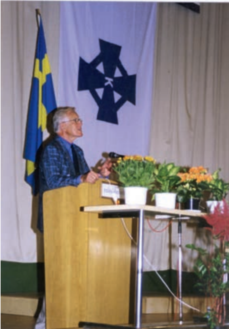
Dag ett avslutades med nattvardsgudstjänst i domkyrkan.

Till detta jubileum hade jag samlat ihop allt bildmateriel som samlats sedan 50-årsjubileet i Västerås och satt upp det i korridoren till aulan i Katedralskolan samt i skolans bibliotek. Där fanns också möjlighet att sitta och slå i förbundets många fotoalbum eller att titta på förbundets video som visades i sådan apparatur som kunde "rulla" under hela dagarna.