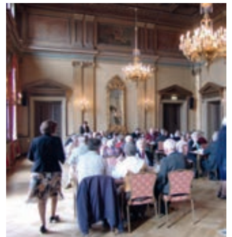
Kristinasalen på Stadshotellet i Kristinehamn