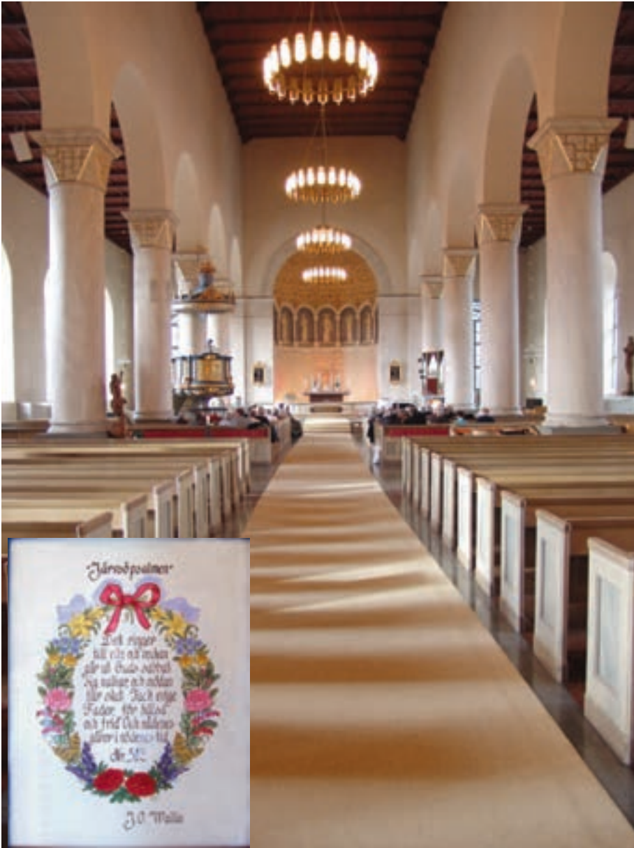
Järvsö Kyrka, Sveriges största landsortskyrka Järvsöpsalmen infälld

Det var i Uppsala stift det började för 90 år sedan