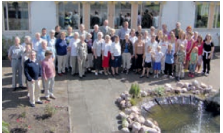
En saling blandning av olika åldrar som gav mersmak i Hjo

Vi hoppas att få möta både stora och små vid rikskonventet i Stockholm! Tillsammans möts vi över generationsgränserna i en härlig gemenskap.