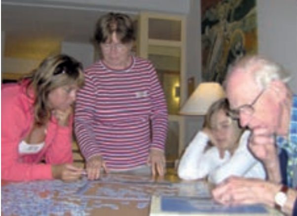
Vid lägerpusslet finns inga åldersgränser