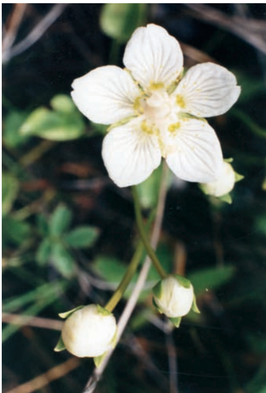
”Jungfru Marie hjärta - Slätterblomman”