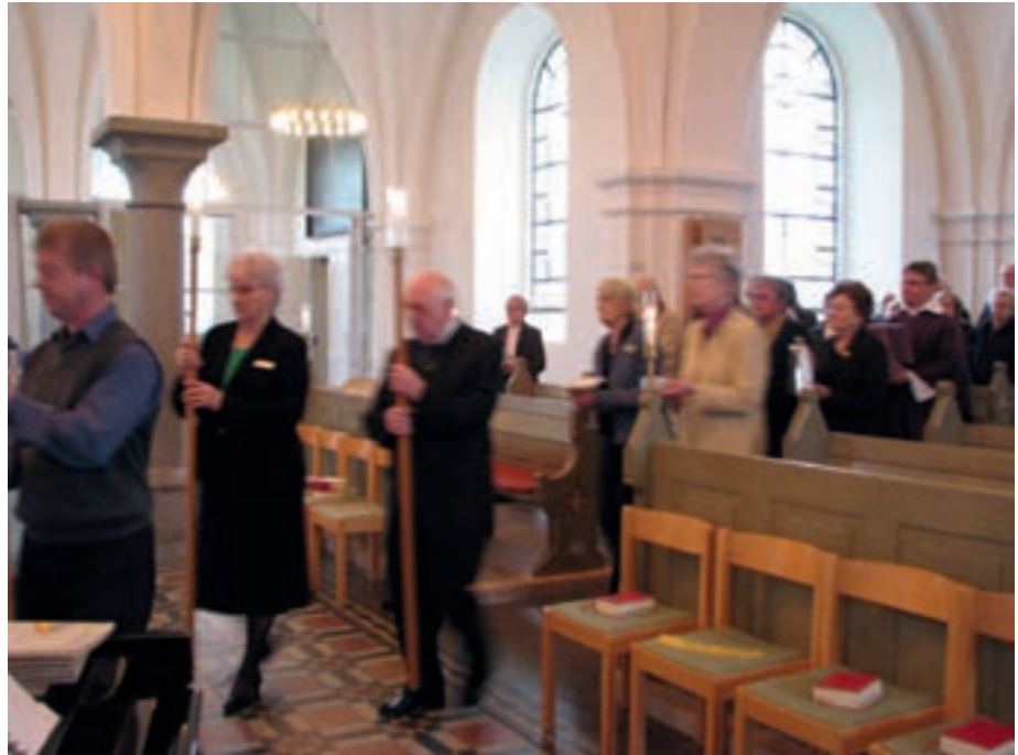
Mässa i Höörs kyrka

Efter mässan samlades gudstjänstdeltagarna i Församlingshemmet för en festlig lunch. Flera gäster uppvaktade med tal och gåvor, vilket glädde kåren.