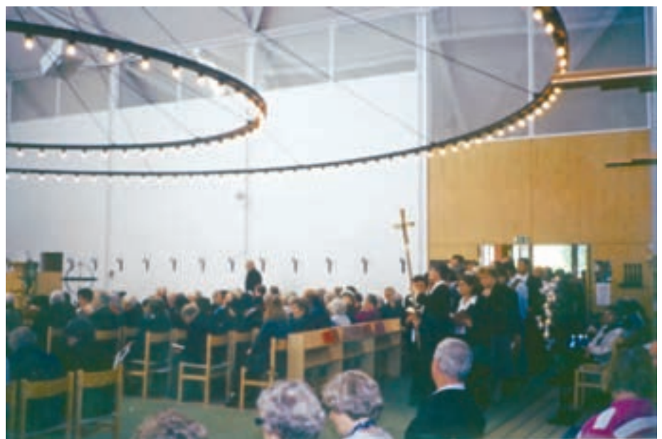
Mässa i Nederkalix kyrka

Men kyrkoherden hade mött stor fromhet bland befolkningen. Ett brödfruktträd som inte burit frukt gav frukt som bönesvar och mättade hungrande barn. I Monrovia fanns en församlings kår. Det fanns en Pingstkyrka med sin