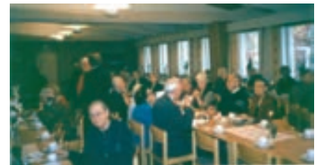
Välkomstkaffe i församlingshemmet

Efter denna givande innehållsrika dag riktar vi ett varmt tack till värdkåren i Nederkalix församling.