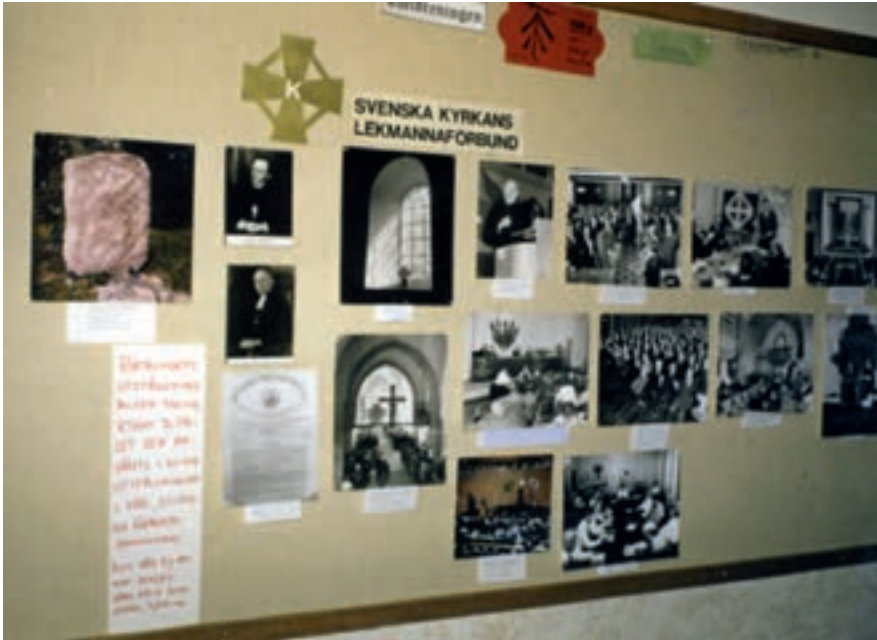
I läroverkskorridoren var förbundets olika fotoutställningar uppsatta.