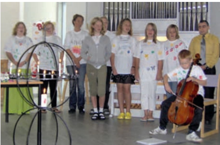
Ungdomar som underhåller och visar upp sina färdigheter

Erfarna och duktiga ledare kommer att göra allt för att de unga deltagarna ska ha så roligt som möjligt. Förutom lek och andra sportiga aktiviteter, blir det sång, pyssel och bibelundervisning – allt i en väl avpassad blandning.